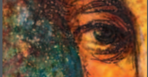
Aquarell im Normal-Modus gescannt.